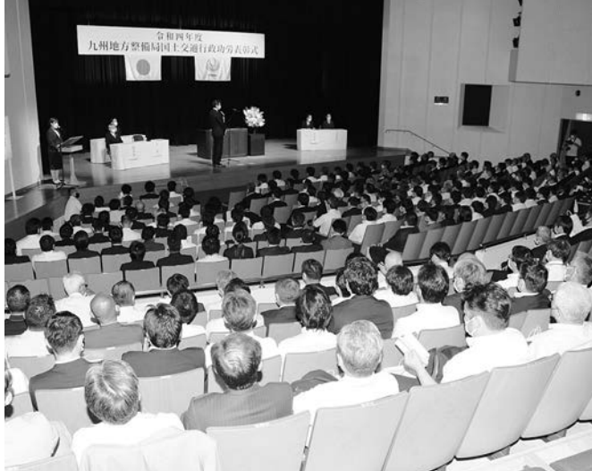
▲4年ぶりに開催された表彰式（福岡市立博多市民センター）