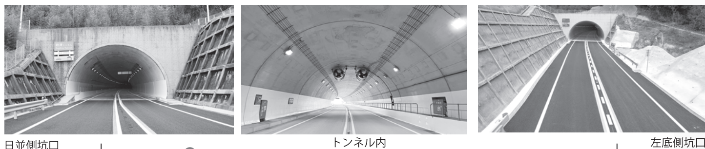
日並側坑口 トンネル内 左底側坑口

延長 1728m 掘削工法 NATM工法 掘削断面 高さ8m×幅13.4m トンネル施設 非常停車帯(上下線各2カ所) 換気施設(1カ所)、 消火設備一式