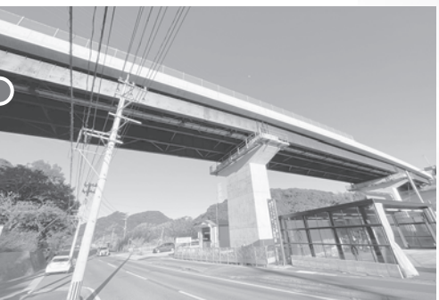
上部工/鋼3径間連続非合成鉄桁橋 下部工/逆T式橋台、張出式橋脚