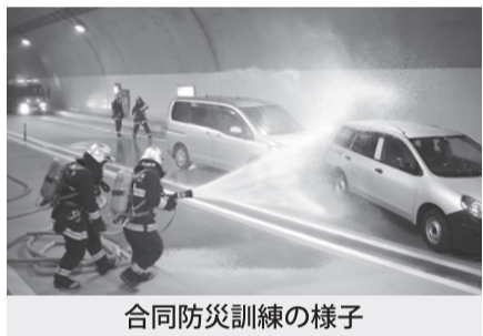
合同防災訓練の様子