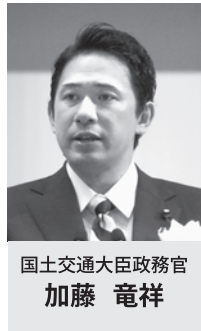
国土交通大臣政務官 加藤 竜祥

今回の開通により、国道57号の渋滞が緩和されるとともに、交通事故の減少など安全性が向上いたします。また島原道路として強靱な道路ネットワークを構成することで、災害時の人流・物流を確保し、沿線地域の雇用が創出されるとともに産業の発展や観光振興など地域活性化に大きく寄与することが期待されます。国土交通省としても、今後地域に皆さま方の期待に応えることができるよう、島原半島の道路ネットワーク早期完成に向け、長崎県や沿線市と一体となって全力で取り組んでいく所存でございます。結びに、激甚化する自然災害に対し、防災・減災・国土強靱化への取組の一層の推進を誓うとともに、地域のますますの発展を祈念いたします。