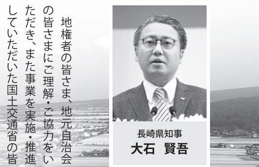
長崎県知事 大石 賢吾

地権者の皆さま、地元自治会の皆さまにご理解・ご協力をいただき、また事業を実施・推進していただいた国土交通省の皆さまや国会議員の皆さまのお力添えあつての開通、すべての方に感謝申し上げます。